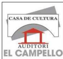
Ajuntament El Campello